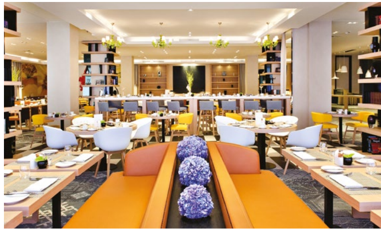
Restauracja Kitchen Gallery

POŁĄCZENIE NOWOCZESNEGO DESIGNU Z KLASYCZNĄ FRANCUSKĄ ELEGANCJĄ W SAMYM SERCU WARSZAWY.